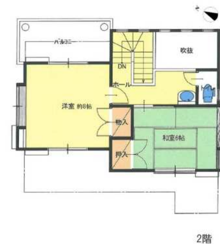
※図面と現況が異なる場合は現況を優先します。